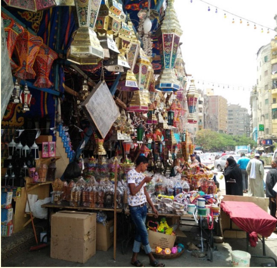
جامع روما الكبير

■ فرحة رمضان في إيطاليا لم تكتمل بسبب عدم قدرة المسلمين على التجمع وإحياء شعائر شهر الصيام، على خلفية التدابير المتخذة لمكافحة تفشي الفيروس. كما أن أبناء الأقلية المسلمة عملوا خلال هذه الفترة على الالتزام بالتدابير التي اتخذتها الجهات الرسمية لمنع انتشار كورونا قدمت إدارة الشؤون الدينية بالاتحاد التركي الإسلامي المساعدة لـ 100 أسرة متضررة جراء كورونا في عموم إيطاليا.