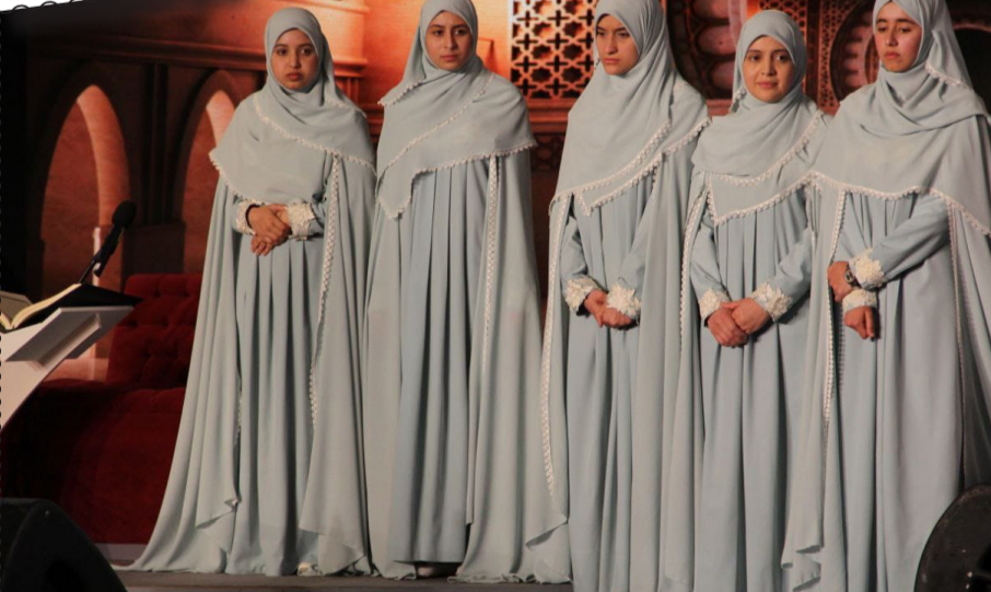
بطلات تاج القرآن الطبعة الـ 12 لسنة 2023