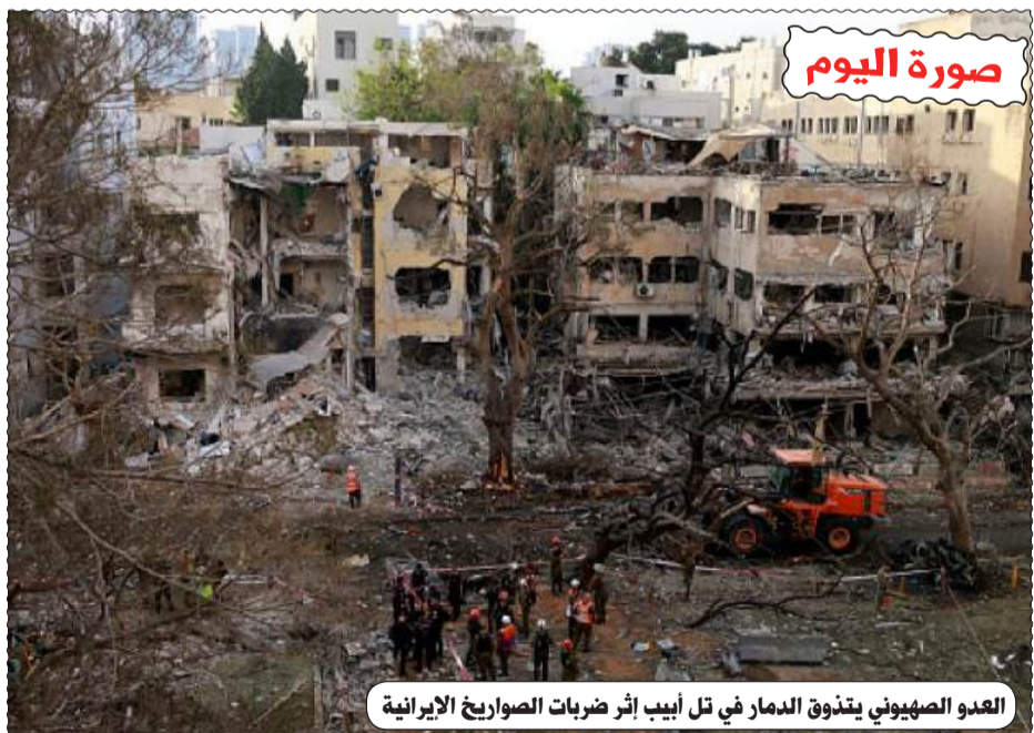
العدو الصهيوني يتذوق الدمار في تل أبيب إثر ضربات الصواريخ الإيرانية