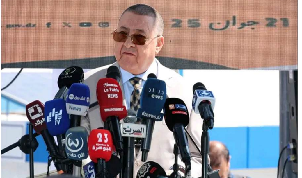
عنابة: خضراوي يحي

جدير بالذكر أن المدينة الساحلية النابضة عنابة عاشت أمس على وقع انطلاق موسم اصطياف يُراهن عليه لإبراز وجه الجزائر السياحي، وفتح آفاق أوسع للنمو المحلي والترويج لثقافة الاستجمام الآمن والمنظم.