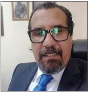
بقلم: يونس العموري

في زنازين لا ترى الشمس، حيث يُراد للروح أن تنكسر وللذاكرة أن تمحى، يقف مروان البرغوثي كجدار لا يتصدع، كأن التاريخ كله قد اجتمع في جسده، وكان صلابته الأرض التي أنجبتة قد تسللت إلى عروقه. هناك، حيث الحديد أعمى، والجلاد يظن أنه سيد المصير، يولد المعنى الحقيقي للحريّة، لا كشعار يُرفع، بل كوجع يقاوم.