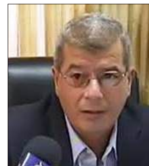
بقلم : عيسى قراق

أن تجارب الشعوب تشير أن الاستعمار لا يقتصر على السيطرة على الأرض بل إلى محاولات السيطرة على الصوت والصورة وإسكات الضحايا والذاكرة، ومن هنا جاءت أهمية مؤتمر توثيق التاريخ الشفوي الذي نظّمته وزارة الثقافة يوم 6.4.2026، وضرورة وأهمية توثيق منات الشهادات والأصوات للأسرى والأسيرات المفرج عنهم من سجون ومعسكرات الاحتلال والتاجين من حبال المشانق، خاصة بعد حرب الإبادة الدموية على قطاع غزة في السابع من أكتوبر 2023.