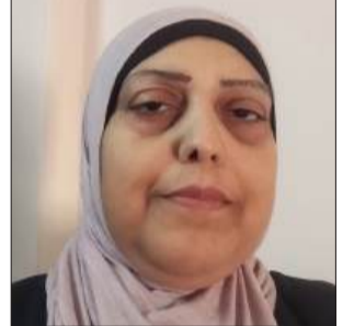
بقلم: سهير سلامة

حل علينا يوم الأسير الفلسطيني، في السابع عشر من نيسان الماضي حاملاً معه ذاكرة ثقيلة من الألم، ومشبعة بمعاني الصمود والإصرار، هو ليس مجرد مناسبة عابرة، بل هو محطة إنسانية ووطنية، تتجدد فيها الحكاية، حكاية آلاف الأبناء والبنات، الذين ما زالوا خلف قضبان حديدية لا تعرف الرحمة، ولا تجد سبيلاً للقلب أم باتت في الم انتظار.