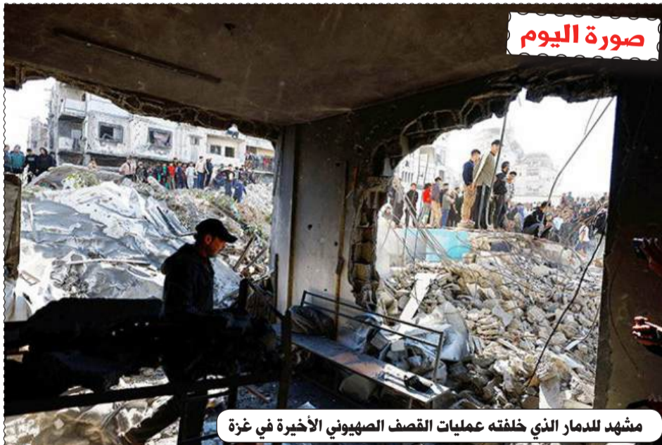
مشهد للدمار الذي خلفته عمليات القصف الصهيوني الأخيرة في غزة

الطبع : مؤسسة الطباعة للشرق SIE التوزيع : قروعة للتوزيع موقع عين الجزائر على الانترنت : www.aineldjazair.dz البريد الإلكتروني: aineldjazaircne2020@gmail.com