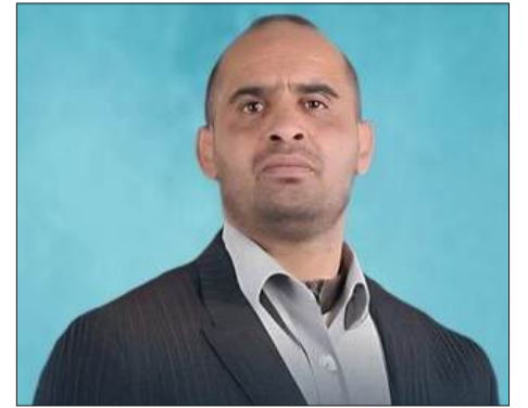
بـقلم: بن معمر الحاج عيسى

في زمن تزدهم فيه الأخبار بالدمار والمآسي، وتختنق فيه الشاشات بصخب الحروب ووجع الأرقام، تأتي رسالة بسيطة من طفلة جزائرية لا تتجاوز الثامنة من عمرها، لتعيد تشكيل المعادلة كلها. رسالة لم تكتب بحبر الصحف ولا بصوت المذيعين، بل كتبت بقلم دميها الصغيرة، وبتوقيع قلب لم يعرف بعد كيف يكون الكره، لكنه اتقن فن الحب حد الإبداع.