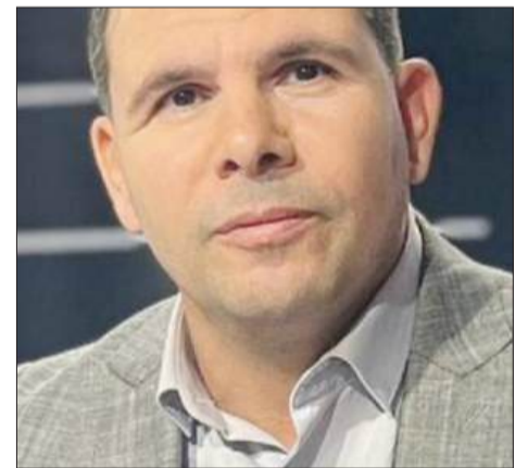
بقلم: د. راند ناجي

في لحظات معينة من تاريخ الشعوب، لا تعود الدعوات مجرد نصوص تُقرأ، بل تتحول إلى مرامييا تعكس عمق الوعي الجمعي، وإلى خرائط ترسم حدود الانتماء الحقيقي. هكذا يأتي نداء المشاركة في فعاليات يوم الأسير الفلسطيني، لا بوصفه إعلاناً ميدانياً عابراً، بل باعتباره خطاباً مشحوناً بالدلالات، حيث يتقاطع الزمن بالمكان، ويتكثف الموضوع في صيغة أخلاقية لا تقبل التأجيل ولا الحياد.