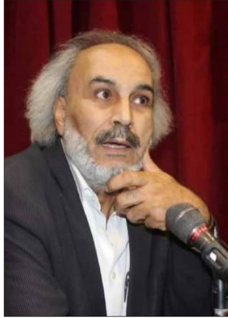
بقلم: -حسن حميد

ما أفدح الأثمان التي دفعتها، ونحن نواجه هذه الكيانية الإسرائيلية البغيضة التي استولت على كل العمران الفلسطيني الذي تباهى به بريطانيا اليوم في متاحفها، مثله مثل ما سرقت من المناطق التي احتلتها، وأنشأت لها وزارة المستعمرات البريطانية، وتدعى زوراً وبهتاناً، بأن هذا العمران كان بسبب (سياسات الانتداب)، وهم، أعني الإنكليز، لم يبنوا في البلاد الفلسطينية سوى المعسكرات للتدريب على القتل الفوري، والسجون الشنائة لوأد حياة المقاومين الفلسطينيين!