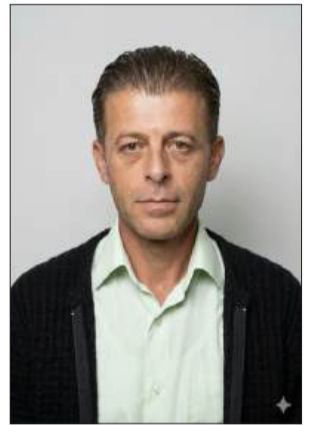
بقلّم : سماحه حسون

الأسرى لا يعيشون الزمن كما نعيشه؛ هم يربّون اللحظة،