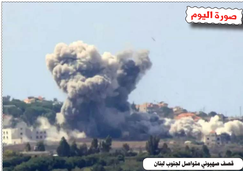
قصف صهيوني متواصل لجنوب لبنان