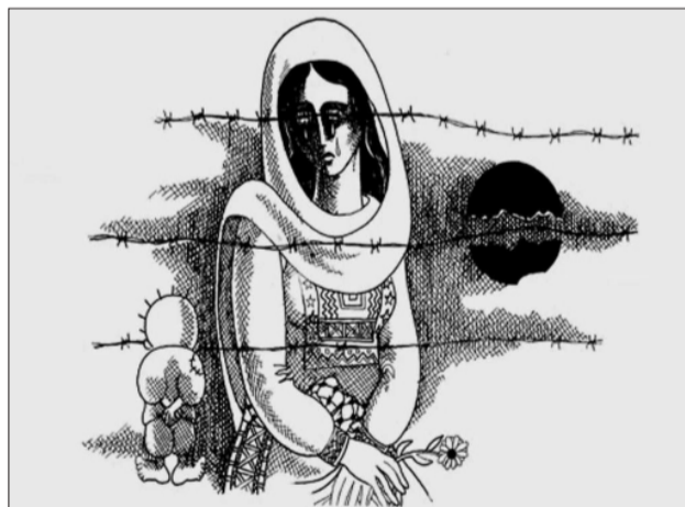
كاريكاتير الفنان ناجي العلي

ما أجمله وختمنا درس وحلّت المسألة إذا انتصرنا» هذا المقطع وحده يكشف عن روح الكتاب. فالحلم هنا ليس سياسياً فحسب، ولا شخصياً فقط، بل هو حلم إنساني بامتياز؛ حلم ببساطة الحياة، وبكرامة العيش، وبعودة الدهشة إلى عيون الأطفال. وكان الشاعر يعيد تعريف النصر: ليس بوصفه حدثاً صحابياً، بل حالة من السكينة، وقدرة على الجلوس معاً دون خوف، وعلى النظر في العيون دون حراجز. إنني، بصراحة، مندهش من هذا الكتاب؛ مندهش من قدرته على أن يكون بسيطاً وعميقاً في آن واحد. ومن هذا التحول الذي شهده مشروع عبد السلام، من شاعر يكتب قصيدة النشر، إلى كاتب يجعل النشر ذاته يتحول إلى شعر. وهذا ليس أمراً يسيراً، بل