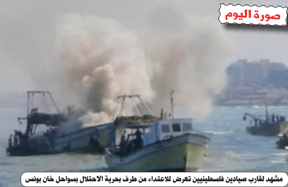
مشهد لقارب صيادين فلسطينيين تعرض للاعتداء من طرف بحرية الاحتلال بسواحل خان بونس

الطبع : مؤسسة الطباعة للشرق SIE التوزيع : قربة للوزيع موقع عين الجزائر على الانترنت : www.aineldjazair.dz البريد الإلكتروني: aineldjazaircne2020@gmail.com