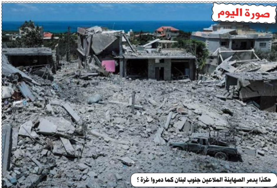
هكذا يدمر الصهاينة الملاعين جنوب لبنان كما دمروا غزة ؟

الطبع : مؤسسة الطباعة للشرق SIE التوزيع : قربة للوزيع موقع عين الجزائر على الانترنت : www.aineldjazair.dz البريد الإلكتروني: aineldjazaircne2020@gmail.com