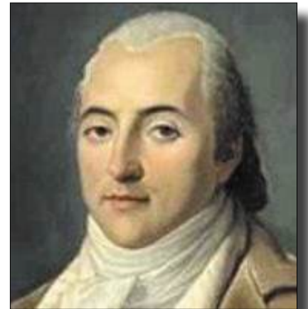
يُصنّف كلود هنري سان سيمون الفيلسوف الاقتصادي الفرنسي كأحد المصلحين الاجتماعيين ومؤسسي الاشتراكية المسيحية، وكان جده

ومر كلود هنري سان سيمون، بمحطات مختلفة في حياته حتى وفاته في فرنسا، حيث تخلى سيمون عن لقب نبيل واختار لنفسه لقب الدرويش ليمتاشي مع قناعته من جانب، ويتلاءم مع النظام الجديد من جانب آخر، ثم عمل في التجارة لفترة من الزمن وفرت له ثروة معتبرة ولكنه أساء استغلالها حتى تبيدت، اضطر معها للعمل ككاتب في إحدى جمعيات التسليف لتدبير احتياجاته اليومية. المحنة الأخرى في حياة سان سيمون، بعد وفاة خادمه الذي كان يقدم له يد العون حيث عانى صعوبات كثيرة كان لها بالغ الأثر في تحديد اتجاهاته في الكتابة، ومواقفه السياسية المتشددة، وفي عهد حكومة المديرين عاد سان سيمون إلى مقاعد الدراسة عام 1798، واتسم في تلك الفترة