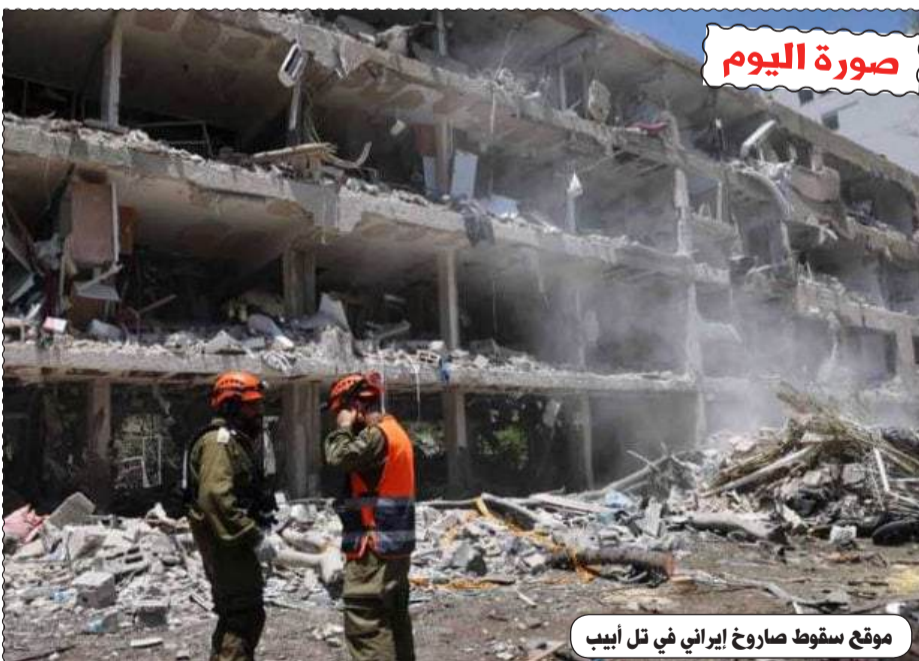
موقع سقوط صاروخ إيراني في تل أبيب