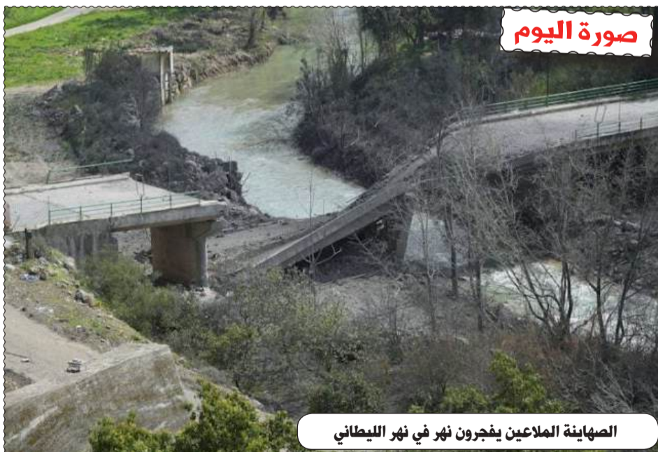
الصهانية الملاعين يفجرون نهر في نهر الليطاني