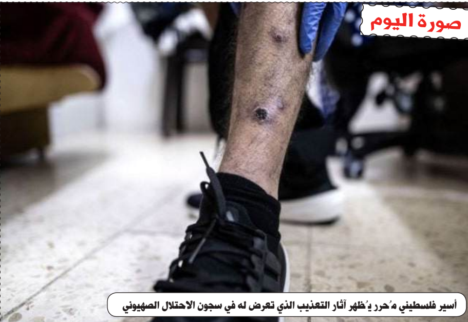
أسير فلسطيني هُزِر يُظهر آثار التعذيب الذي تعرض له في سجون الاحتلال الصهيوني

الطبع : مؤسسة الطباعة للشرق SIE التوزيع : قربة للتوزيع موقع عين الجزائر على الانترنت : www.aineldjazair.dz البريد الإلكتروني: aineldjazaircne2020@gmail.com