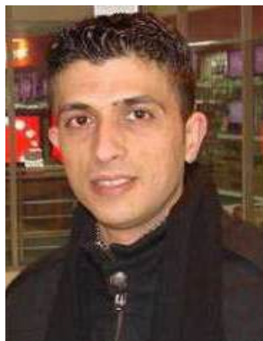
بقلم: بهاء رحال

■ وفي مقاربة حقيقية، فإن أسرارنا ولداً من جديد، وخرجوا إلى الحياة بعد أن ظن الاحتلال أنهم سيقفون في سجنهم إلى الأبد. ولأن قيدَ المحتل لا يبقى للأبد، كسر الأبطال القيد وخرجوا أحراراً من عتمة المعتقل، وغياهب السجون إلى فضاء الوطن والحرية.