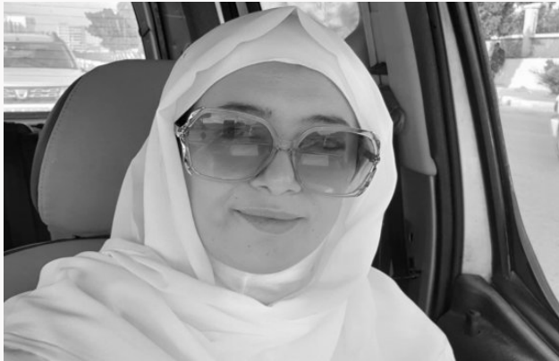
في الموقع الإلكتروني ليومية «الجمهورية» أيضا لتعود بعدها إلى القسم المحلي.

توفيت ليلة الجمعة الصحفية بجريدة «الجمهورية» تلمسي حيزية عن عمر يناهز 42 سنة، حسبما علم اليوم السبت لدى ذات اليومية العمومية.