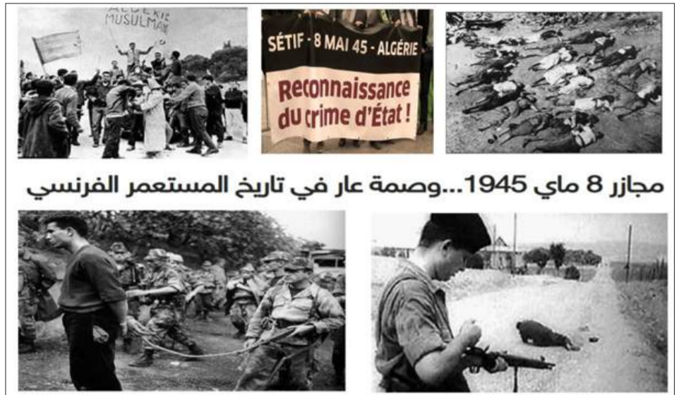
مجازر 8 ماي 1945... وصمة عار في تاريخ المستعمر الفرنسي

الموتى» لوضع إكليل الزهور. لكن في الواقع، كان الوطنيون الجزائريون، بتحفيظ من فرحات عباس ونشطاء «أحباب البيان»، قد جابوا في الليلة السابقة كل أرجاء سطيف والقرى المجاورة، داعين إلى تعبئة شعبية واسعة ومفسرين الغاية الحقيقية من المسيرة والمتمثلة في المطالبة باستقلال الجزائر.