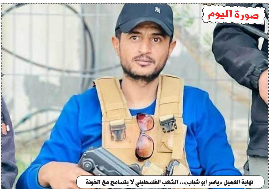
نهاية العميل «ياسر أبو شباب»... الشعب الفلسطيني لا يتسامح مع الخونة