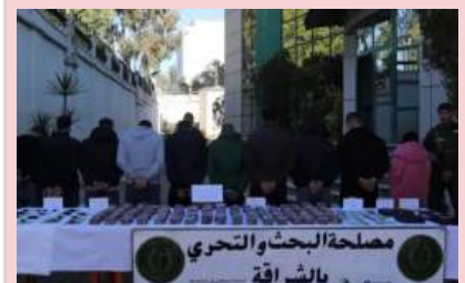
فككت مصلحة البحث والتحري للدرك الوطني بالشرافة، شبكة إجرامية منظمة ذات امتداد دولي مختصة في المتاجرة بالأفراس المهلوسة والمؤثرات العقلية، حسب ما أفاد به بيان لذات المصالح.

وأوضح البيان، أن العملية مكنت من توقيف 10 أشخاص منهم امرأة، مع حجز 16921 كبسولة مهلوسات، 19 مركبة وشاحنتين. ووفقا لذات المصدر، هذه الشبكة ذات امتداد دولي مختصة في التهريب والاستيراد غير المشروع للمخدرات والمؤثرات العقلية بشتى أنواعها، على درجة عالية من الخطورة مهددة للأمن الوطني والصحة العمومية. وكذا الحيازة النقل والتخزين لغرض المتاجرة غير المشروعة بالمخدرات والمؤثرات العقلية في إطار جماعة إجرامية منظمة وكذا جنحة تبييض الأموال وتزوير هياكل المركبات ووثائقها. وتم، حسب البيان، حجز كمية معتبرة من المؤثرات العقلية قدرت بـ 16921 كبسولة، 19 مركبة سياحية وشاحنتان، مبلغ مالي من العائدات الإجرامية بقيمة 340000 دج وهواتف نقالة.