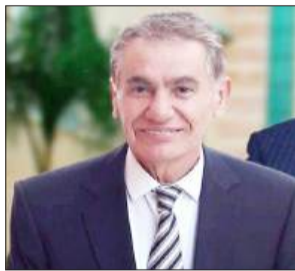
بقلم: جلال محمد حسين نشوان

أسرانا الأبطال، مدارس العزة والكرامة في رحاب الفكرة والثورة، التي استطاعت أن تخلق حالة نضالية عريضة، وأفق ممتد، للبديين النضالي والانسائي، فكان الأسير الفلسطيني العملاق يصقلها، ويعطيها رونقاً فكرياً وإنسانياً وثقافياً، لتصل إلى كل الأحرار في هذا الكون.