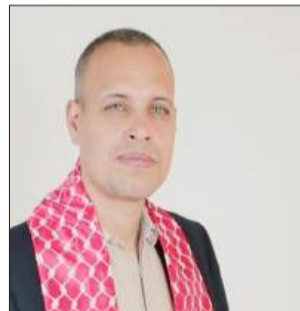
بقلم: وسام زغير عضو الأمانة العامة لنقابة الصحفيين الفلسطينيين

لا يقتصر الإخفاء القسري على كونه انتهاكاً قانونياً خطيراً، بل يتجاوز ذلك ليصبح جريمة إنسانية مركبة تمس حياة الأفراد والعائلات والمجتمع بأكمله. وفي سياق الاحتلال الإسرائيلي، يتحول الإخفاء القسري في السجون والزنازين إلى سياسة تُبقي مصير المعتقلين غامضاً، وتحرم عائلاتهم من أبسط حقوق المعرفة والأطمئنان. إنه شكل من أشكال العنف الصامت، حيث يُغيب الإنسان خلف الجدران، وتتسكع عائلته رهينة الانتظار القاسي.