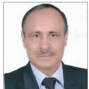
بقلم: شريف ابراهيم احمد

في زمن تتكاثر فيه الشعارات، وتضمّر فيه الأفعال، يخرج إلى السطح ما يُسمى بـ«قانون إعدام الأسرى الفلسطينيين» كجرح جديد في جسد العدالة الدولية، وكاشف فاضح لاختلال ميزان القيم في هذا العالم. ليس الأمر مجرد نصّ قانوني يُناقش داخل أروقة برلمان، بل هو إعلان صريح عن سقوط أخلاقي مدوّ، وعن عنجهية تستند إلى فائض القوة، وتستقوي بصمت دولي يكاد يرقى إلى مستوى التواطؤ.