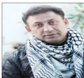
بقلم: سامي إبراهيم فودة

ليس أخطر من رصاصه تُطلق في لحظة اشتباك... إلا قانون يُصاغ في قاعة باردة، ليمسح تلك الرصاصه شرعية القتل باسم "العدالة"، ما جرى ليس مجرد قرار عابر، ولا تشريع قانوني يُدرج في سجلات البرلمانات... بل هو لحظة فاصلة في تاريخ الصراع، حيث تنتقل آلة القمع من ممارسة القتل كفعل ميداني، إلى تبنينه كمنظومة قانونية متكاملة الأركان.