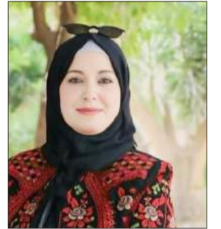
بقلم: د. منى أبو حمديا وباحثة

إن إقرار ما يُعرف بقانون إعدام الأسرى في الكنيست بالقراءتين الثانية والثالثة لا يمثل مجرد تشريع عادي، بل يشكّل تحولاً خطيراً في بنية المنظومة القانونية والسياسية، ويعكس توجهاً نحو استخدام القانون بصورته الحالية كأداة ردع قاسية في سياق صراع سياسي معقد. فهذا الإجراء التعسفي، بما يحمله من أبعاد عقابية استثنائية، يضع إسرائيل أمام اختبار حقيقي لمدى التزامها بمبادئ العدالة الدستورية والقانون الدولي الإنساني.