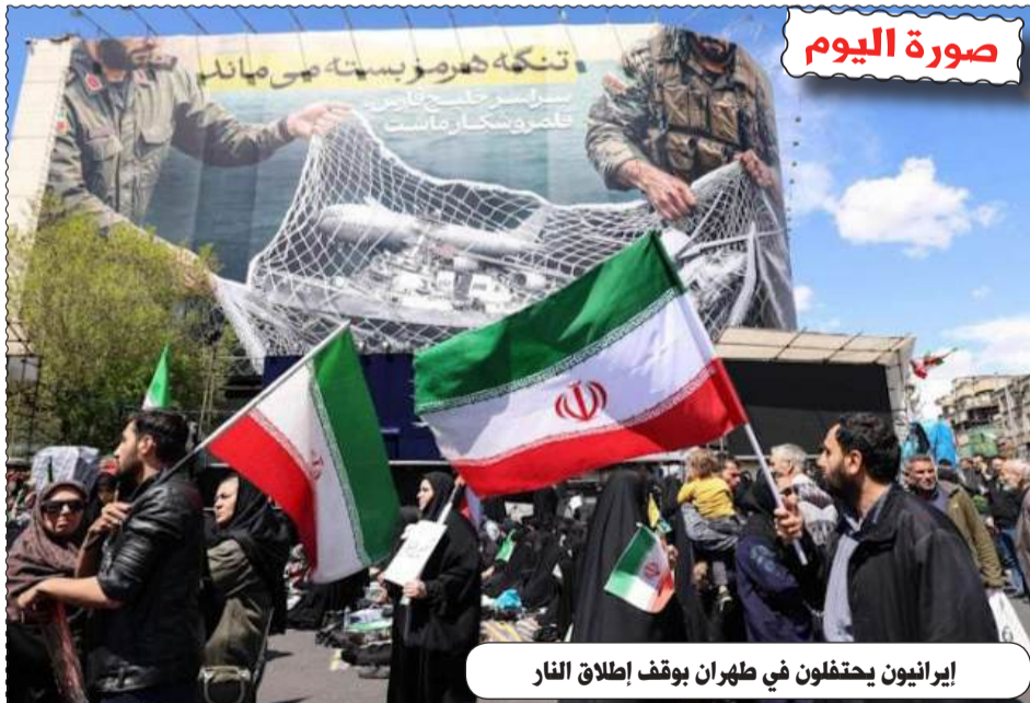
إيرانيون يحتفلون في طهران بوقف إطلاق النار

الطبع : مؤسسة الطباعة للشرق SIE التوزيع : قروعة للتوزيع موقع عين الجزائر على الانترنت : www.aineldjazair.dz البريد الإلكتروني: aineldjazaircne2020@gmail.com