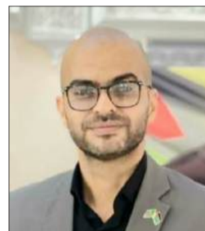
بقلم الناشط الحقوقي الفلسطيني أ. شريف الصباغ

يشهد الكنيست الإسرائيلي مرحلة جديدة من التشدد التشريعي، من خلال الدفع نحو إقرار مشروع قانون يجيز فرض عقوبة الإعدام بحق الأسرى الفلسطينيين داخل السجون الإسرائيلية، في خطوة تُعد من أخطر التحولات في بنية المنظومة القانونية الإسرائيلية منذ عقود، لما تحمله من أبعاد قانونية وسياسية وإنسانية عميقة.