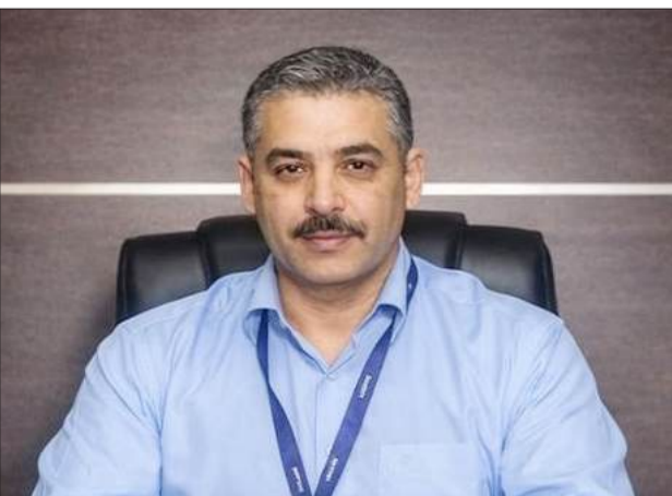
يعد واحداً من شهداء الحركة الأسيرة الذين ارتقوا في سياق تصاعد الانتهاكات بحق الأسرى الفلسطينيين

يناير 2026 واستشهد داخل سجن مجدو بعد أشهر من الاعتقال، في ظل ظروف قاسية داخل السجن.