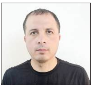
بقلم: راند عبد الجليل

لا يمثل قانون إعدام الأسرى الذي أقره الاحتلال مجرد تشريع قانوني عابر في سجل كيان قام على أنقاض الحقوق، بل هو صرخة مدوية تعري المنظومة القانونية والأخلاقية للعالم بأسره. هذا القانون لا يسقط القناع عن الاحتلال فحسب، فقد سقط ذلك القناع منذ أمد بعيد، بل هو تعرية "للعالم" بكل أطيافه؛ عرباً وعجماً، مسلمين ومسيحيين وهندوس، وحتى أولئك الذين لا يؤمنون بدين. إنه إعلان رسمي عن إعدام ما تبقى من قيم إنسانية في وجه عالم يناقش بمبادئه حين يقف العجز سيد الموقف أمام دماء المناضلين.