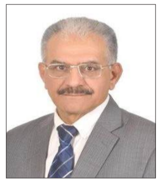
بقلم: د. عبد الرحيم جاموس

غير أن الأخطر في هذا السياق هو ما يمكن تسميته بـ"الفاشية القانونية"، حيث يتم توظيف المؤسسات التشريعية لإضفاء الشرعية على ممارسات تنتهك جوهر العدالة. فبدلاً من أن يكون القانون أداة لضبط السلطة، يتحول إلى أداة بيدها، تستخدمه لتبرير القمع وتكريسه. وهذا التحول لا يهدد الفلسطينيين وحدهم، بل يهدد فكرة القانون نفسها، ويفتح الباب أمام سابقة خطيرة في العلاقات الدولية. على صعيد القانون الدولي، فإن هذا التشريع، إذا ما تم تطبيقه، قد يندرج ضمن اختصاص المحكمة الجنائية الدولية، باعتباره شكلاً من أشكال الإعدام خارج نطاق المحاكمة العادلة، أو جريمة حرب إذا ما ارتبط بسياسة ممنهجة تستهدف فئة محمية. إن مبدأ عدم الإفلات من العقاب، الذي يشكل حجر الزاوية في العدالة الدولية، يقتضي ملاحقة كل من يساهم في سن أو تنفيذ مثل هذه القوانين.