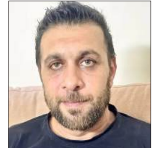
بقلم: لؤي صوالحة

في لحظة يختلط فيها الدم بالتاريخ، ويعلو فيها صوت الأرض فوق كل محاولات الطمس، يخرج الاحتلال من خلف أفتحه القانونية ليعلنها صريحة: القتل حق، والإعدام سياسة، والفلسطيني هدف مشروع. في الذكرى الخمسين ليوم الأرض الخالد، لا يكتفي الكيان الغاصب بسرقة الأرض، بل يسعى لانتزاع الحياة ذاتها من أصحابها عبر إقرار «قانون إعدام الأسرى». ليس قانوناً عابراً، بل بيان حرب مكتوب بلغة التشريع، يختصر عقيدة استعمارية كاملة ترى في وجود الفلسطيني جريمة تستوجب الموت. إنها لحظة انكشاف كبرى، يتحول فيها القضاء إلى منصة إعدام، والقانون إلى رصاصة، والسجن إلى مقصلة مفتوحة.