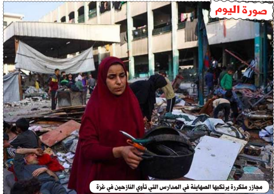
مجازر متكررة يرتكبها الصهاينة في المدارس التي تأوي النازحين في غزة