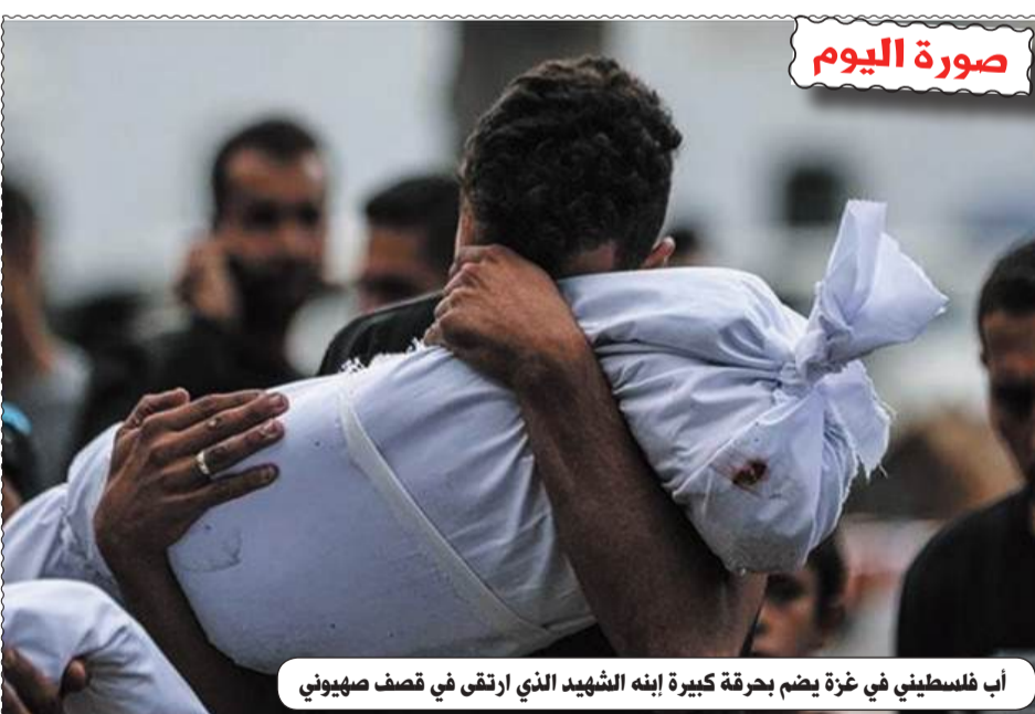
أب فلسطيني في غزة يضم بحرقه كبيرة ابنه الشهيد الذي ارتقى في قصف صهيوني

عين الجزائر- أثارت حادثة العثور على كميات معتبرة من اللحوم الحمراء وبقايا خراف كاملة، ملقاة بطريقة عشوائية بمنطقة «الوادي» على مستوى محور الدوران «سياسوي»، استياء واستنكاراً واسعاً وسط سكان مدينة قسنطينة والمارة عبر الطريق الجانبي المؤدي إلى منطقة «الجزور». وحسب المعطيات المتوفرة، فقد تقاجأ المواطنون بانتشار هذه المخلفات واللحوم المرمية في الهواء الطلق، مما شكل مشهداً صادماً ومثيراً للتساؤلات حول خلفيات وأسباب التخلص من هذه المواد الاستهلاكية بهذه الطريقة غير القانونية، والتي