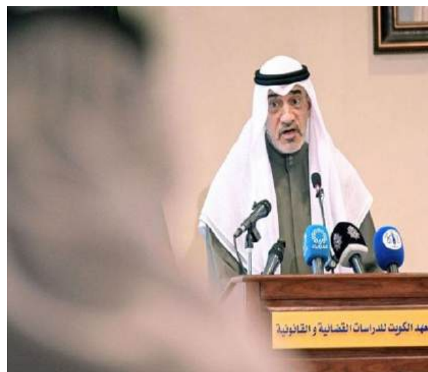
ثلاث سنوات. وأضاف: "أخو يقتل أخته... بهذه القضية. قتل أخته بشهر واحد مخدرات... هيئة. من سنة 2022

كشف رئيس مجلس الوزراء الكويتي بالإنابة ووزير الداخلية، الشيخ فهد يوسف سعود الصباح، عن تفاصيل قضية جنائية صادمة قال إنها أربكته إلى حد أنه "لم يذم منذ الأمس"، مؤكدا أنها تكشف عن مستوى خطير من التخاذل الأسري والإنساني.