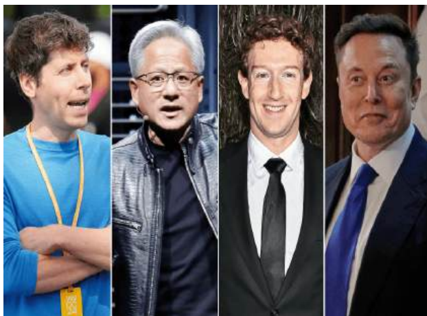
على العالم». وفقا للمجلة، شهد عام 2025

اختارت مجلة «تايم» الأميركية مهندسي الذكاء الاصطناعي شخصية عام 2025، وفي مقدمتهم جنسن هوانغ، الرئيس التنفيذي لشركة «إنفديا»، التي أصبحت خلال العام الجاري الشركة الأعلى قيمة في العالم بفضل هيمنتها على الرقائق المستخدمة في تشغيل نماذج الذكاء الاصطناعي.