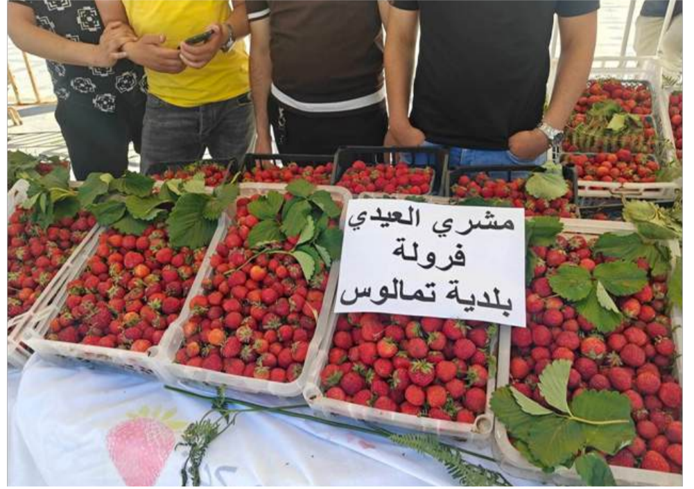
جيجل : نصرالدين دربال عاشت أمس مدينة سكيكدة، على وقع الإنطلاق الفعلي لعيد الفرولة الذي تحققي به روسيكادا كل موسم في 23 من ماي، وهو تقليد يعكس غنى الموروث الشعبي للمدينة التي يعود تأسيسها للحنقة الرومانية الفعالية عرفت حضور والي الولاية سعيد اخروف

و إدارات الولاية و اللجنة الأمنية و العشرات من الفلاحين المختصين في شعبة الفرولة التي عادة بقوة مؤخرًا في بلديات الولاية في ظل عدد من الإجراءات و التدابير التي سبق و ان رفعها «الفلاح» الاحتفالية التي انطلقت في أجواء استعراضية تم الإعداد لها من قبل المنظمين في بلدية سكيكدة، و باقي الشركاء و بمعرض مفتوح على مستوى ساحة اول نوفمبر 1954 بقلب مدينة سكيكدة، و بحضور قوي للعارضين من الفلاحين ومنتجي شعبة الفرولة بكل أصنافها حتى و ان كانت «لمركبة» هي ملكة الفرولة في الولاية لما تمتاز به من نوعية و انتشار غير ان الأجواء البهيجة و الاستعداد الجيد لإنجاح الاحتفالية التي فيها كذلك تكريما للمنتجين و أصحاب الحلويات الذين تفتنوا في صناعة حلويات «الفرولة»، غير أن عدد من الفلاحين العراييل التي تعترضهم في إنتاج الفرولة، مطالبين بالدعم وتهيئة المسالك الجبلية أين تنبت وتنمو اشجار الفرولة التي شهدت توسعا كبيرا للمساحات المزروعة هذه السنة خاصة في تمالوس و كركرة و عين الزويت. نشير فقط، بأن على هامش هذه التظاهرة تقام مسابقة لأحسن وأوفر منتج للفرولة سيعلن عن نتائجها و كذا و مسابقة أحسن مربو و أحسن كعكة و أحسن عصير فرولة في أجواء تنافسية.