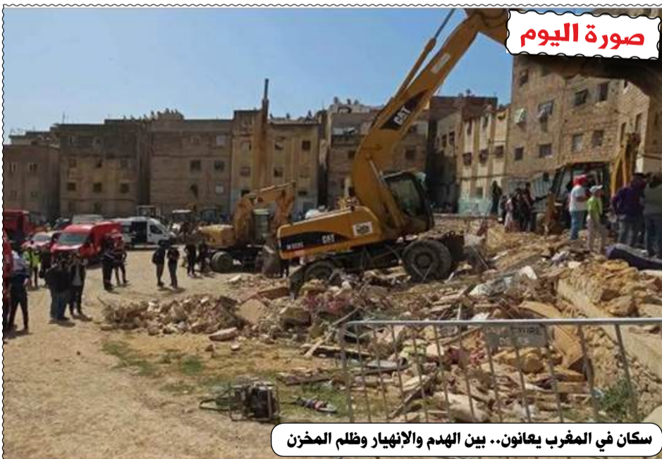
سكان في المغرب يعانون.. بين الهدم والإنهيار وظلم المخزن