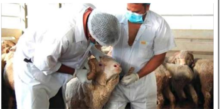
قضاء هذه المناسبة الدينية في أحسن الظروف. تم، في هذا السياق، تسخير 87 بيطريا تابعين لوزارة الفلاحة والتنمية الريفية و الصيد البحري بالتنسيق مع المصالح المختصة، للسهر على مراقبة ومتابعة عمليات الذبح عبر المذابح المعتمدة، ونقاط بيع الأضاحي والأسواق الأسبوعية؛ حرصاً على احترام شروط

النظافة، والصحة العمومية، وحماية المستهلك. مداومة العيد تشمل 884 متعاملاً اقتصادياً وأعد في نفس الإطار مخطط ولائي خاص بالمداومة، شمل 884 متعامل اقتصادي موزعين على مختلف دوائر الولاية. ويتعلق الأمر بـ 134 مخبزة، و 336 محل للتغذية العامة والخضر والفواكه، و 368 مقهى ومطعم ومحل بيع المرطبات، إضافة إلى 35 نشاطاً خاصاً بتصليح العجلات الميكانيكية، إلى جانب 11 وحدة إنتاجية؛ قصد ضمان التموين المنتظم بالمواد واسعة الاستهلاك، واستمرارية النشاط التجاري خلال أيام العيد، فيما تم تسخير 56 عوناً لمراقبة مدى التزام التجار بنظام المداومة، مع تنصيب فرق ميدانية للسهر على التقيد الفعلي بالمخطط. ولتمكين المواطنين من الاطلاع على قوائم المداومة الخاصة بالتجار