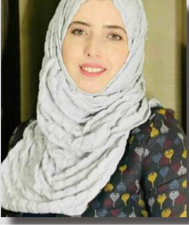
بقلم الأديبة: قمر عبد الرحمن

تعال يا موت.. وانظر للمقيمين فيك كيف يعودون إلينا بعلمهم.. ويشعلون القناديل تعال يا موت.. وانظر إلينا نحن.. الباقون هنا مؤقتاً.. كيف نضع من الحرف عمراً طويلاً تعال يا موت.. فيقدر غموضك.. علمتنا أن نعشق الكذب والتفصيلا ونحن في وطني نموت ولا نموت.. لأننا نحيا الوطن إجمالاً وتفصيلاً كانت الطريق بلا طريق يا موت.. ورغم ذلك مشيناً.. مشينا كثيراً للحياة أرففة.. نسينا شكلها كانت تواعدنا وأصبحت بك قبورا وإن عدنا إليها.. وجدنا ظلنا ملقى هناك.. يفقد التورا فكل هروب منك هروب إليك.. ولن نعذب من الماتاهة والتعب.. إذا تركت لنا من الخلود وهجاً يسيرا الموت كالمعاني.. وربما أبعد أبعد من أسرار الحروف والله يشهد وكلمنا قلنا: ازدانت الحياة بأفراحها يظهر وجه الموت وسطها ويتوقد وكلمنا حاورناه، وقلنا: لا تستعجل.. بأخذ من نحب يصمت عن القول ويرتد وهو حق.. والأحق في أن يصيبنا بالحيرة فله صفة الجلال والتّمدد أجل.. تغتالنا الذكريات لكننا نحب كل يوم جديد.. رغم الحزن المارق على الملامح.. تندرب على النسيان.. وما زالت الأيأم دليلاً وكل من غابوا حضروا.. في دواخلنا أضعاف الغياب.. وهذا يجعل الوجع ذليلاً وهذا يجعل الوجع ذليلاً