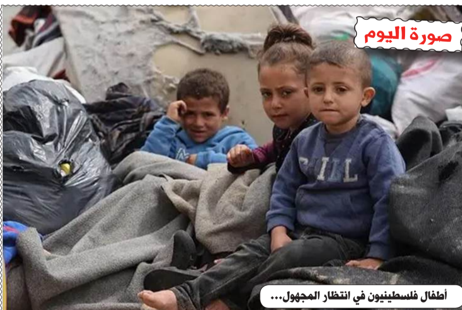
أطفال فلسطينيون في انتظار المجهول...