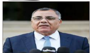
بقلم : د. إبراهيم ملحم