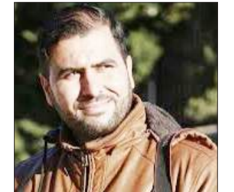
بقلم الأسير: المحرر - عامر أبو عرفة

في سجون الاحتلال، لا يُقاس الألم بحجمه، بل بقدرته على التسلسل إلى الروح، فخلف الأبواب الحديدية، حيث يُفترض أن يُترك الإنسان وحيداً مع وجعه، يحدث العكس تماماً. يتكاثر الوجع، نعم، ولكنه يتوزع، يُقسم، يُخفف، حتى لا ينهار أحد.