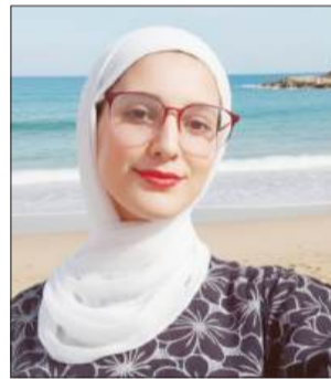
بقلم: هبة محمد تيم.

في عالم يُفترض فيه أن الطفل يبحث عن ألوان الرسم وساحات اللعب، يجد منات الأطفال الفلسطينيين أنفسهم في مواجهة واقع مغاير تماماً؛ جدران باردة، زنازين ضيقة، وساعات انتظار لا تنتهي. إن قضية الأطفال في سجون الاحتلال ليست مجرد ملف سياسي، بل هي استنزاف ممنهج لجيل يُراد له أن ينسى معنى الأمان تحت وطأة سياسات تنتهك أبسط حقوق الإنسان.