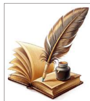
بقلم: فاطمة حرارة - غزة

في الثالث من مايو، «اليوم العالمي لحرية الصحافة»، تلقى الخطابات الرنانة في القاعات المكيفة عن حماية الكلمة. لكن في فلسطين، وتحديدًا في غزة، يُكتب الخبر بالدم، وتتحوّل الكاميرا من أداة لنقل الحدث إلى هدف مباشر في قلب الإبادة.