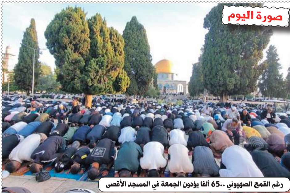
رغم القمع الصهيوني .. 65 ألفا يؤدون الجمعة في المسجد الأقصى

الطبع : مؤسسة الطباعة للشرق SIE التوزيع : قربة للترتيب موقع عين الجزائر على الإنترنت : www.aineldjazair.dz البريد الإلكتروني: aineldjazaircne2020@gmail.com