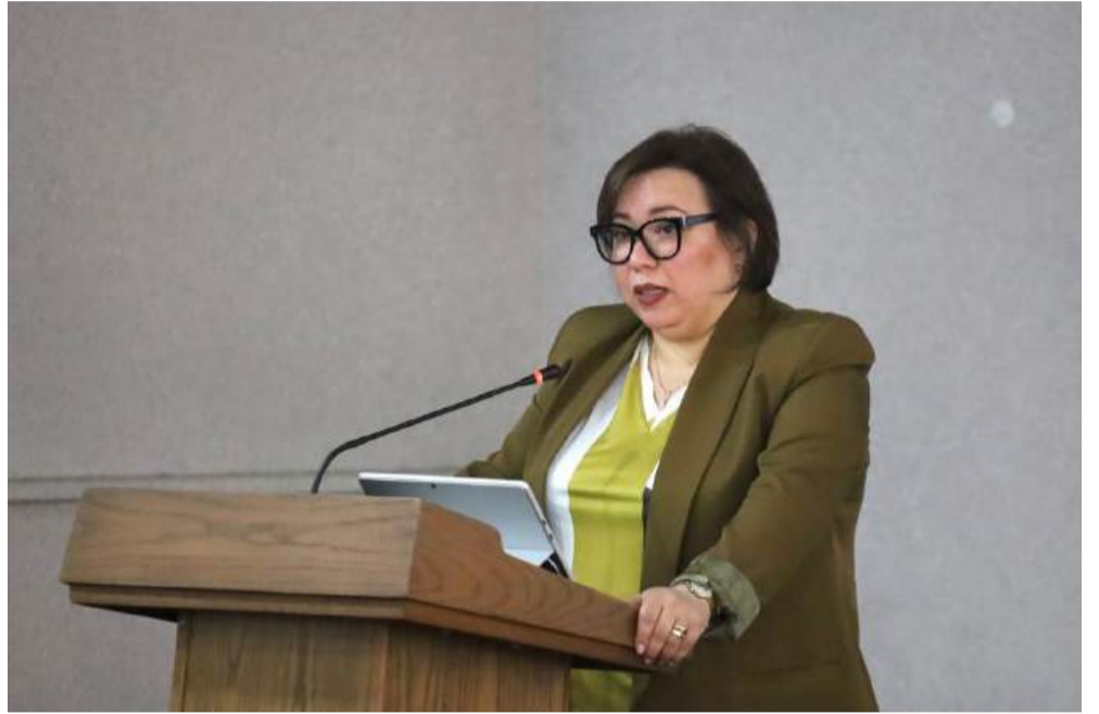
أشرفت وزيرة التكوين والتعليم المهنيين، نسيمه أرحاب، بمعهد التكوين والتعليم المهنيين، ببئر خادم، على الانطلاق الرسمي لدورة التكوين التكميلي ما قبل الترقية لفائدة أساتذة و موظفي القطاع على