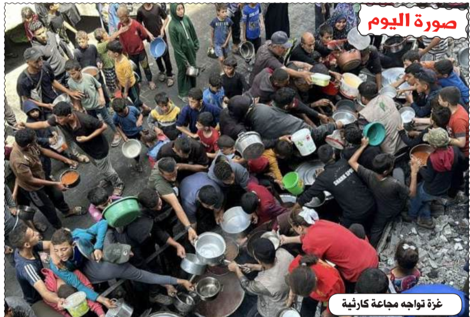
غزة تواجه مجاعة كارثية