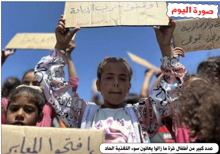
عدد كبير من أطفال غزة ما زالوا يعانون سوء التغذية الحاد

الطبع : مؤسسة الطباعة للشرق SIE التوزيع : قربة للوزيع موقع عين الجزائر على الانترنت : www.aineldjazair.dz البريد الإلكتروني: aineldjazaircne2020@gmail.com