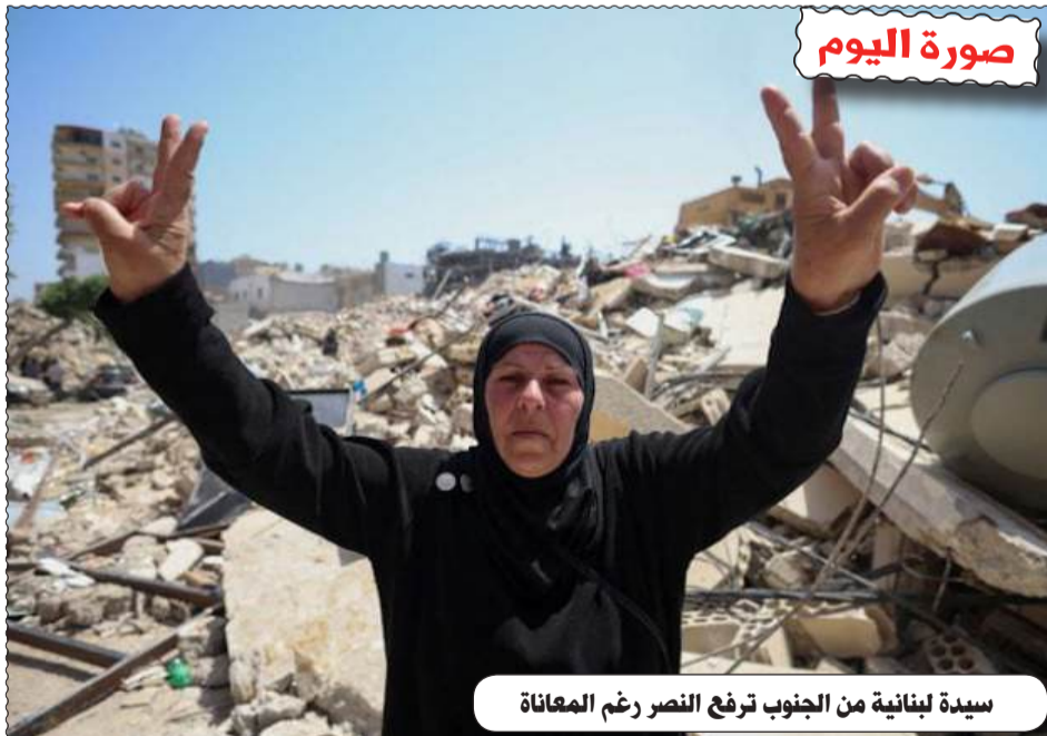
سيدة لبنانية من الجنوب ترفع النصر رغم المعاناة