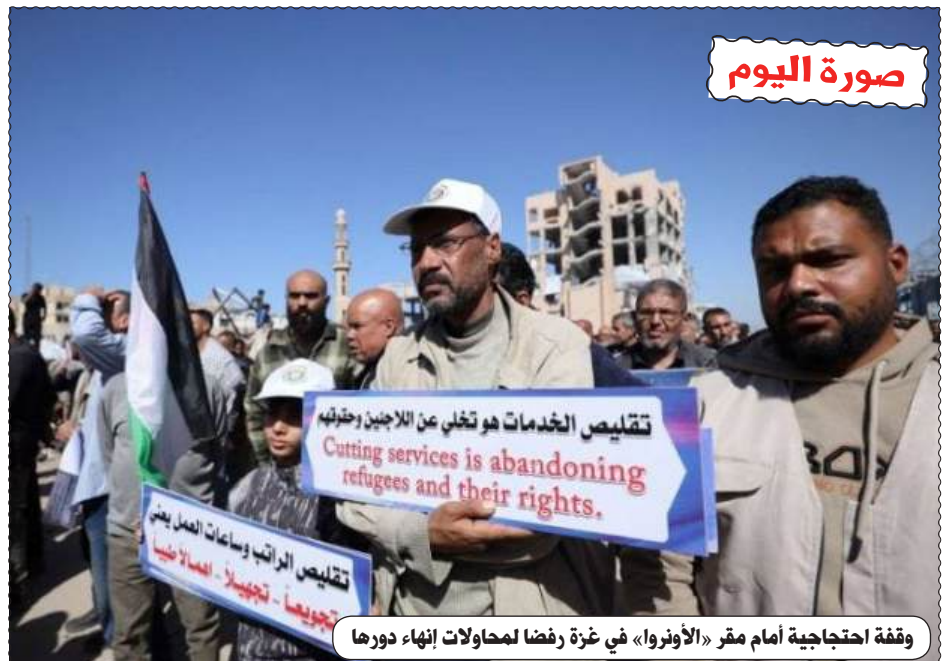
وقفة احتجاجية أمام مقر «الأونروا» في غزة رفضا لمحاولات إنهاء دورها