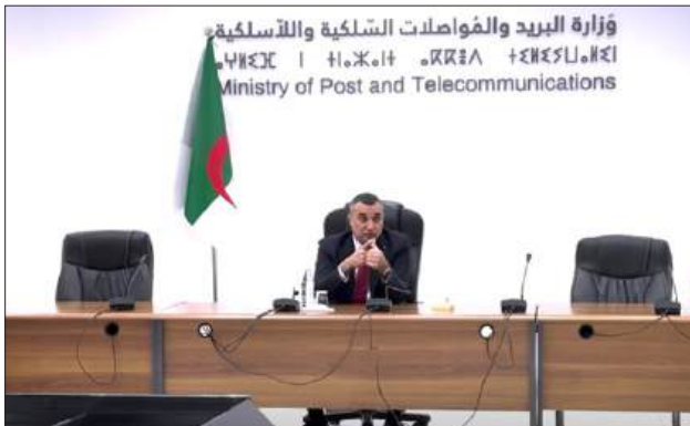
■ أشرف وزير البريد والمواصلات السلكية واللاسلكية، سيد علي زروقي، على لقاء تشاوري جمعه بممثلين عن مجتمع الألعاب الإلكترونية في الجزائر بمختلف مكوناته، من مؤسسات ناشئة، مقاولين ذاتيين مطورين للألعاب،