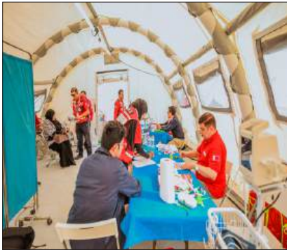
■ انطلقت، أمس الثلاثاء، في سبيلين بالقرب من مدينة مسيعيد في قطر فعاليات المخيم الميداني العاشر للتدريب على إدارة الكوارث، الذي ينظمه الهلال الأحمر القطري تحت شعار "تأهب فعال... واستجابة أفضل"، بمشاركة 300 مدرب ومتدرب من الهلال الأحمر القطري، وصندوق قطر للتنمية، والمؤسسات القطرية الحكومية وغير الحكومية، والجمعيات الوطنية والمؤسسات الإغاثية في منطقة الشرق الأوسط

وشمال أفريقيا. ويقام المخيم برعاية رئيس مجلس الوزراء وزير الخارجية القطري، الشيخ محمد بن عبد الرحمن آل ثاني، ويستمر على مدى ثمانية أيام، ويتضمن برنامج مخيم إدارة الكوارث العاشر محاضرات نظرية، وتدريبات عملية، وسيناريوهات محاكاة، ومعايشة واقعية، لتطبيق أحدث ما وصل إليه العمل الإنساني في مجالات: التقييم والإصحاح، الميداني، والإيواء الطارئ، والمياه والإصحاح، والأمن الغذائي، وسبل العيش، والتخطيط للطوارئ، وغرفة العمليات، والصحة في الطوارئ، والإعلام والاتصال في الطوارئ، والمعايير الإنسانية الأساسية، وتحليل المعلومات الإنسانية، والدعم النفسي الاجتماعي، والوصول الآمن، وإعادة الروابط العائلية، وغير ذلك من الموضوعات والمهارات الضرورية لتمكين الكوادر الإغاثية من تنفيذ المهام والإجراءات الميدانية على أكمل وجه. ويمثل المشاركون من داخل قطر جهات عدة، منها: الهلال الأحمر القطري، أكاديمية الخدمة الوطنية، صندوق قطر للتنمية، قطر الخيرية،