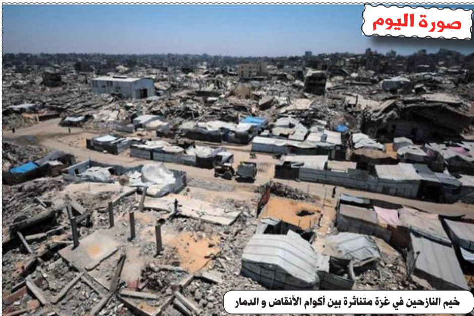
خيم النازحين في غزة متناثرة بين أكوام الأنقاض والدمار